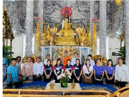
สุขสิ่งแวดล้อม