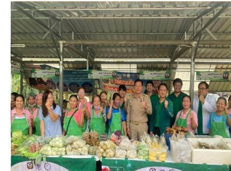
สุขเศรษฐกิจ