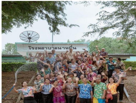
สุขสุขภาพดี

เครือข่ายพัฒนาสุขภาพระดับอำเภอหนามื่น จังหวัดน่าน